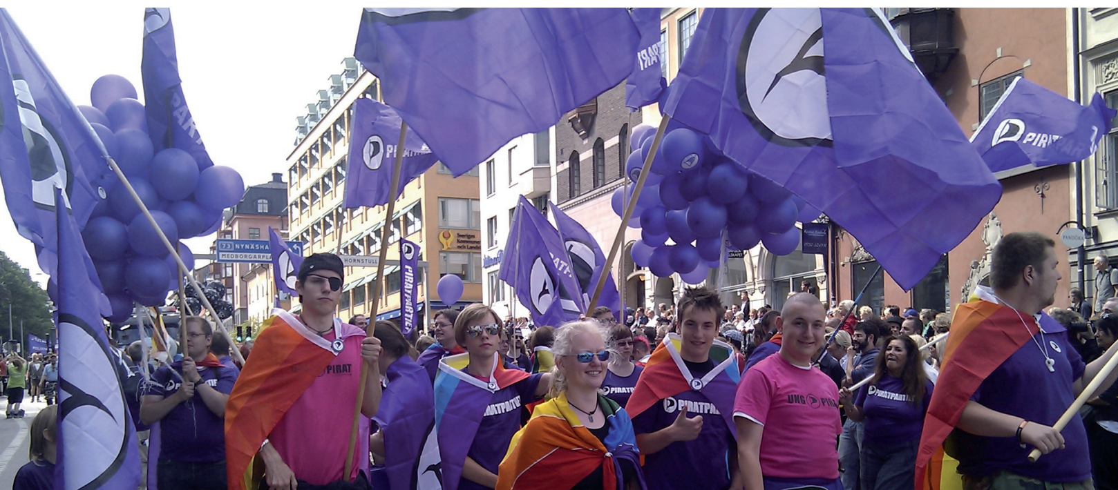
Ruotsalaisia piraatteja Pride-tapahtumassa.