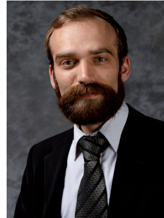
Kirjoittaja on piraattipuolueen puheenjohtaja

Seuraavat vaalit ovat Euroopan parlamentin vaalit loppukeväästä 2014. Eurovaaleihin asetetaan enintään 20 ehdokasta valtakunnallisesti. Kyseessä on ensimmäinen kerta, kun jokaisessa Suomen kunnassa on mahdollista äänestää piraattia.