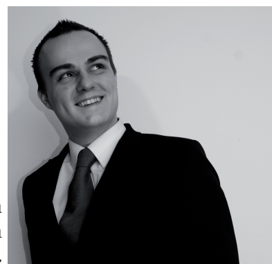
Kirjoittaja on Piraattinuorten puheenjohtaja.

Haluamme myös herättää keskustelua siitä, tarvitsemeko rakkaudellemme valtion siunauksen. Yhteiskunta ilman avioliittolakiä mahdollistaisi todellisen tasa-arvon, vahvistaisi avioliiton asemaa ja nostaisi kansalaisten ihmissuhteet poliittisen debatin yläpuolelle.